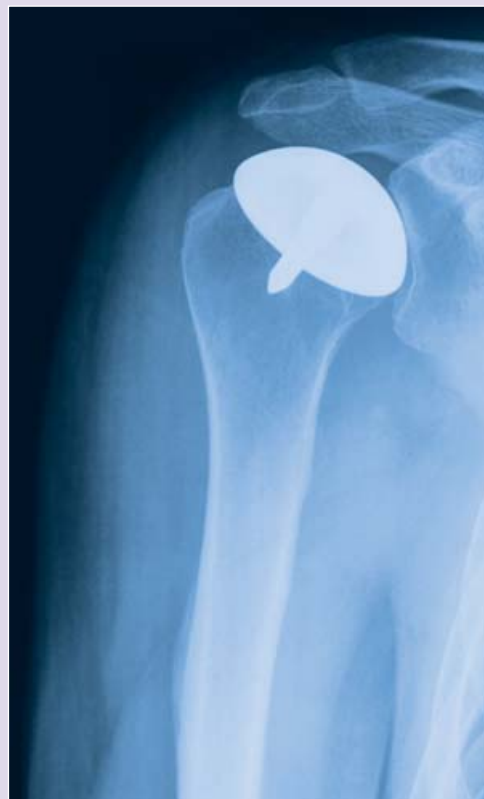
Röntgenbild nach Gelenkersatz

Unterseite der „Global C.A.P.“™ mit Porocoat® (Beschichtung mit zufällig verteilten Kugeln mit geeigneter Porengröße für gutes, knöchernes Einwachsen)