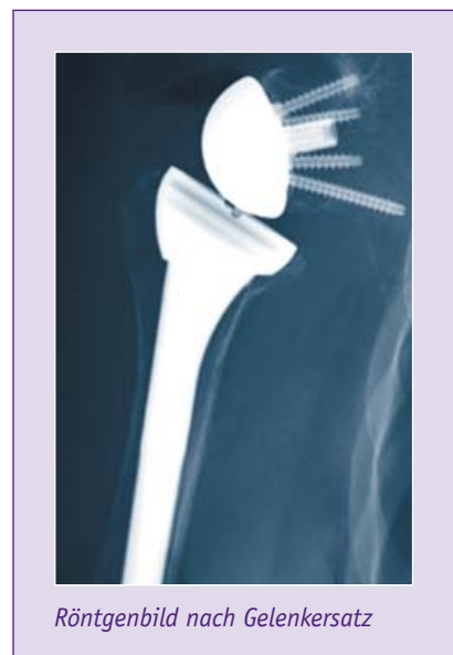
Röntgenbild nach Gelenkersatz