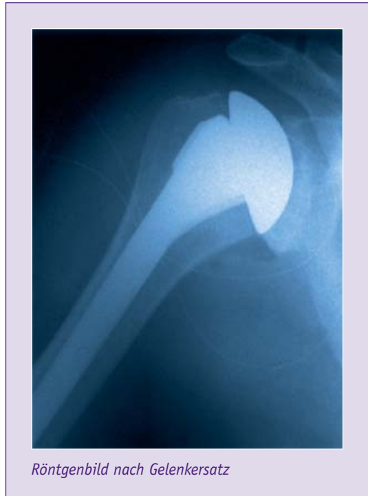
Röntgenbild nach Gelenkersatz

Der Oberarmanteil der Prothese kann zementiert oder zementfrei eingesetzt werden, die künstliche Gelenkpfanne wird entweder mit Knochenzement oder mit Schrauben fixiert. Zur Erlangung einer guten Beweglichkeit ist die korrekte Wiederanheftung der abgelösten Muskulatur ausgesprochen wichtig.